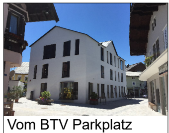
Vom BTV Parkplatz